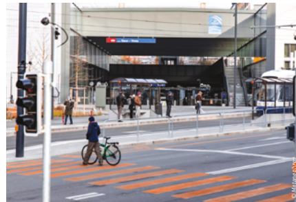
Espaces publics autour de la gare des Eaux-Vives à Genève