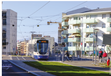
Prolongement du tramway vers Annemasse