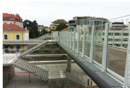
Nouvelle passerelle de l'interface multimodale de Thonon-Les-Bains